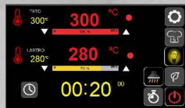
Tela multi toque