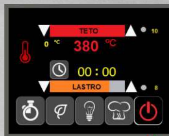
Tela multi toque